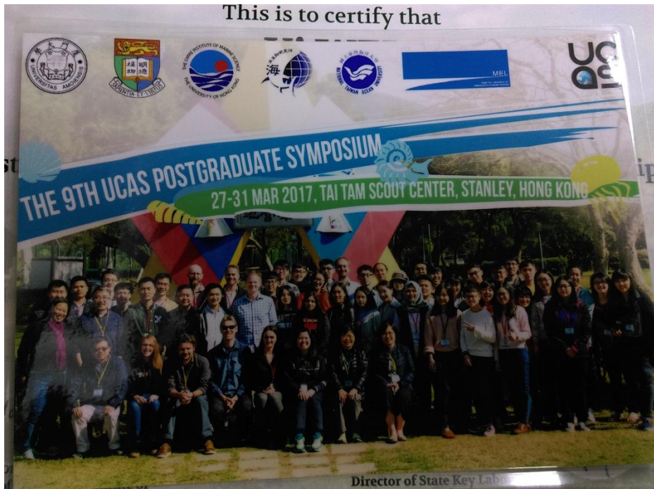
圖六、參與人員合照