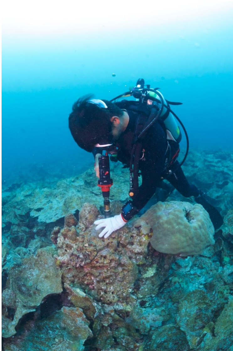
圖七、東沙採樣圖，我用電鑽鑽取岩芯