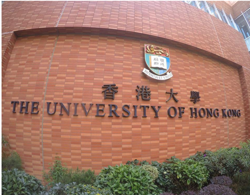
圖三、香港大學一處