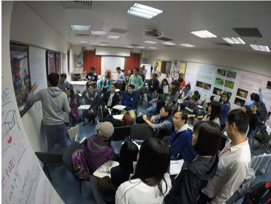
圖一、於香港大學與各參與學員研討