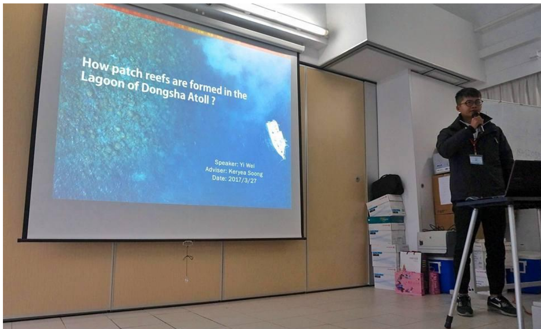
圖二、我個人的口頭論文報告